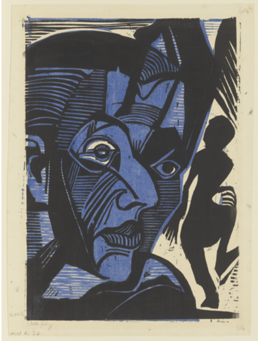
Ernst Ludwig Kirchner, Selbstbildnis (Melancholie der Berge), 1929, als gemeinfrei gekennzeichnet

Zunächst werden die Schüler*innen vor einem hellen Hintergrund in der Frontalansicht fotografiert. Wenn es möglich ist, können sich die Schüler*innen natürlich auch gegenseitig ablichten. Am Ende des Fotoshootings sollte man von allen Schüler*innen eine Porträtaufnahme haben. Diese werden anschließend in schwarz-weiß ausgedruckt. Allen Schüler*innen sollten für das Unterrichtsvorhaben mind. zwei Ausdrücke auf Din A4 und ein Ausdruck auf DIN A3 zur Verfügung stehen. Nun beginnt der eigentliche Verfremdungsprozess. Mit einer Schere werden die Fotokopien in verschiedene Teile geschnitten. Die einzelnen Fragmente des Gesichts werden dann auf einem weißen DIN A3 Papier zunächst ausgelegt und schließlich mit einem Klebestift aufgeklebt. Einige Schüler*innen explorieren in dieser Phase mit großer Neugier, wie aus dem eigenen Abbild etwas völlig Neues erschaffen wird. Anderen fällt es hingegen sichtlich schwer, das Äußere zu verfremden. Die Schüler*innen müssen in diesem Gestaltungsprozess vermittelt bekommen, dass sie alle gestalterischen Freiheiten haben. Die Collagen können im Folgenden mit Stiften oder Tonpapierresten grafisch erweitert werden.